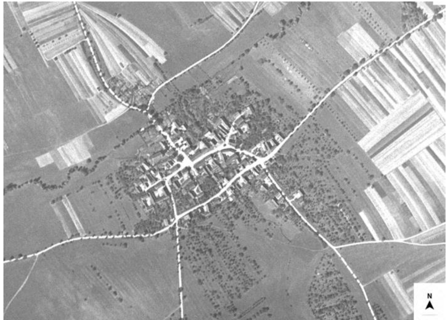
Photo aérienne prise le 1er août 1935

L'image de notre village la plus ancienne date de 1935.