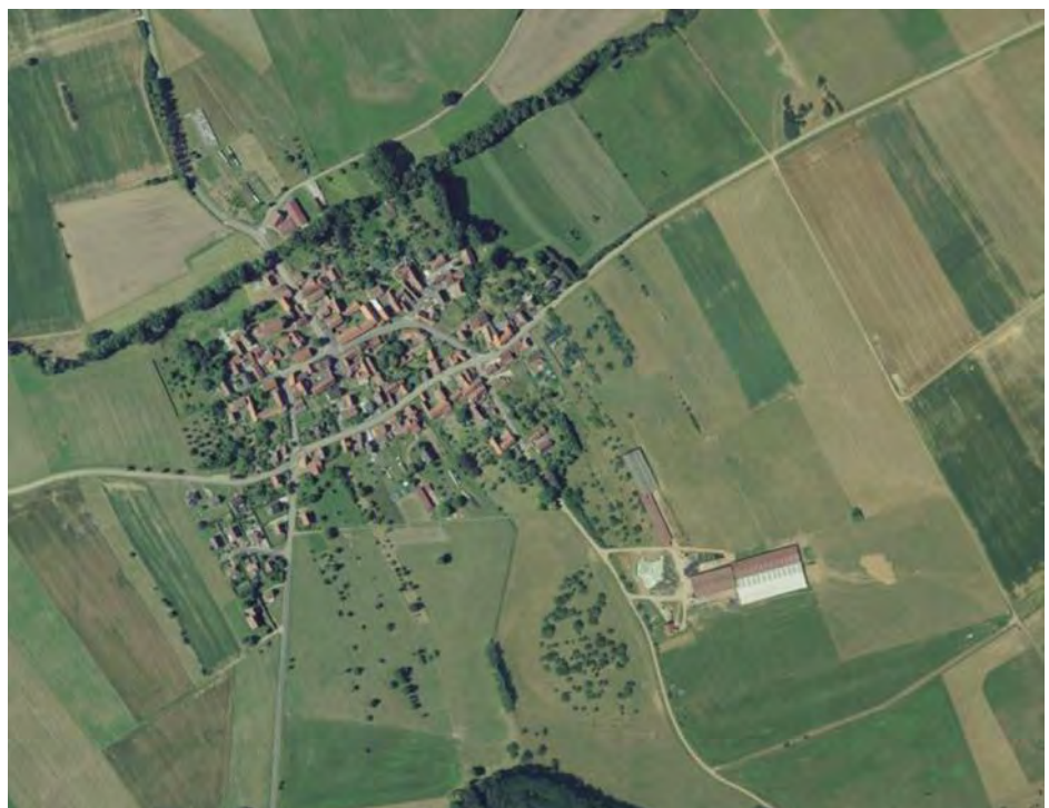
Photo aérienne 2015-2019