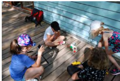
Atelier Stop Motion Playmobil