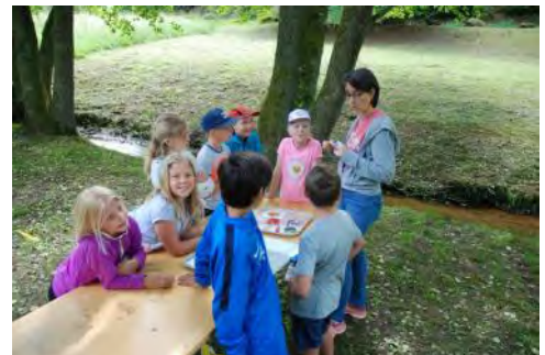
Atelier Mieux manger avec la nutritionniste