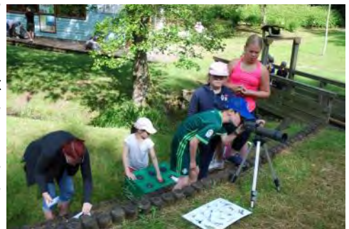
Atelier Découverte de la nature, faune et flore